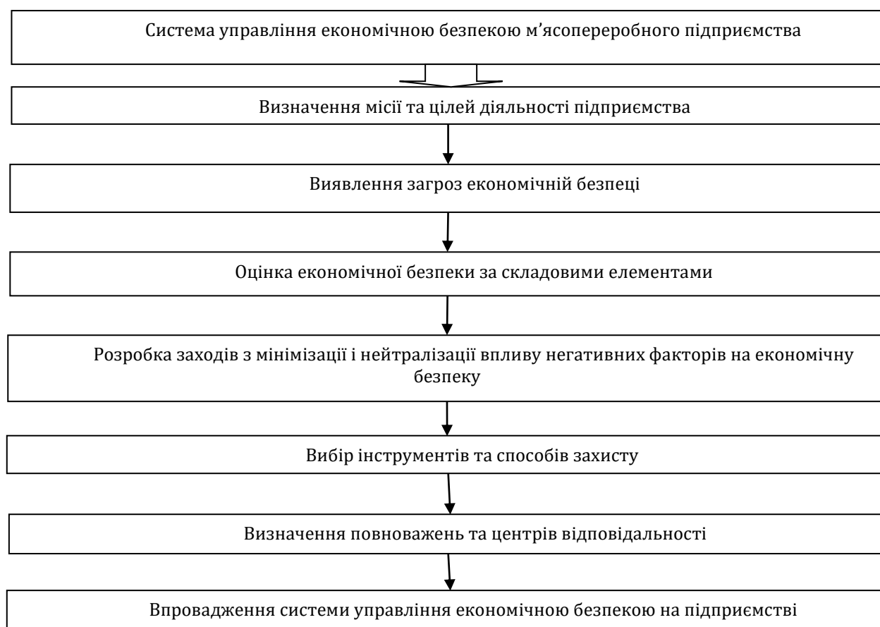
Рис. 1. Система управління економічною безпекою м'ясопереробного підприємства

Основними об'єктами її захисту є: продукція підприємства, персонал, комерційні таємниці та внутрішня інформація, інтелектуальна власність, фінансові ресурси, основні оборотні та виробничі фонди, нематеріальні активи, репутація підприємства.