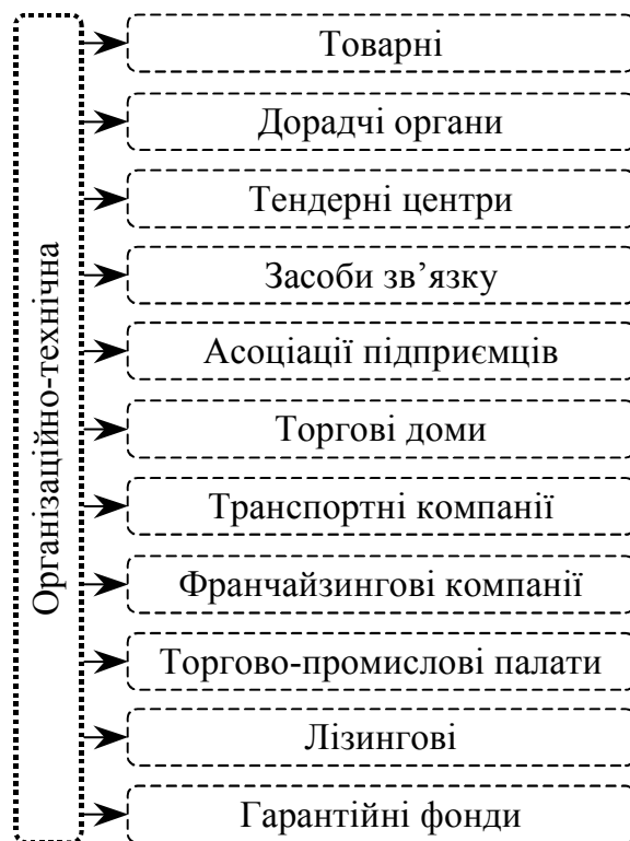
Рис. 4. Інфраструктура підтримки розвитку малого підприємництва за організаційно-технічним способом

Однак майже 67% усіх інноваційних фондів і компаній країни функціонує у м. Київ та Вінницькій області. У більшості областей створено лише по одному або два таких заклади.