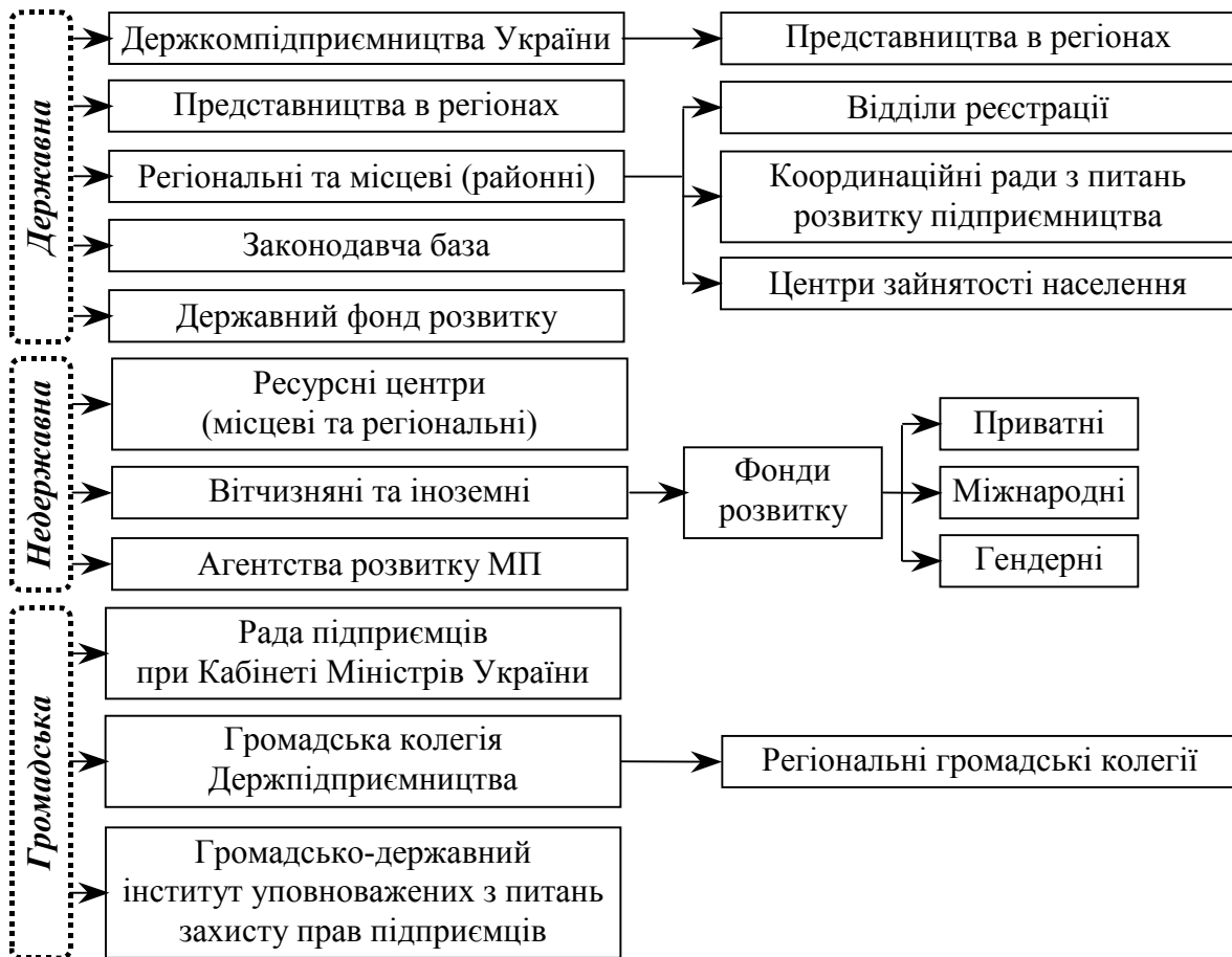
Рис. 3. Інфраструктура підтримки розвитку малого підприємництва за способом заснування

Стосовно Указу Президента України № 1085/2010 р. «Про оптимізацію системи центральних органів виконавчої влади» з метою оптимізації системи центральних органів виконавчої влади, усунення дублювання їх повноважень, забезпечення скорочення чисельності управлінського апарату та витрат на його утримання, підвищення ефективності державного управління повністю ліквідований державний орган Держпідприємництва та його представництва в регіонах. Однак, зараз готується проект змін до цього указу про створення представництв Держпідприємництва в реформованому вигляді, а саме: в деяких великих регіонах з одним, в останніх – в одно представництво на кілька регіонів. У зв'язку з цим, на рис. 1,3,4 державний орган Держпідприємництва та його представництва в регіонах надані у визначальному форматі, тобто як було до реформування.