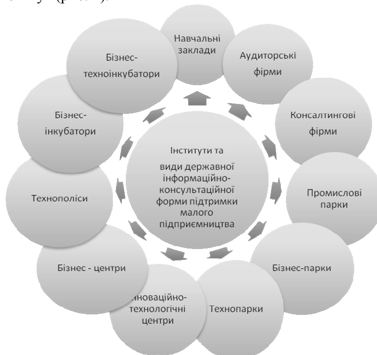
Рис. 2. Інститути та види державної інформаційно-консультаційної форми підтримки малого підприємництва

Ефективною формою державної підтримки малого підприємництва є інформаційно-консультаційний інститут (рис. 2).