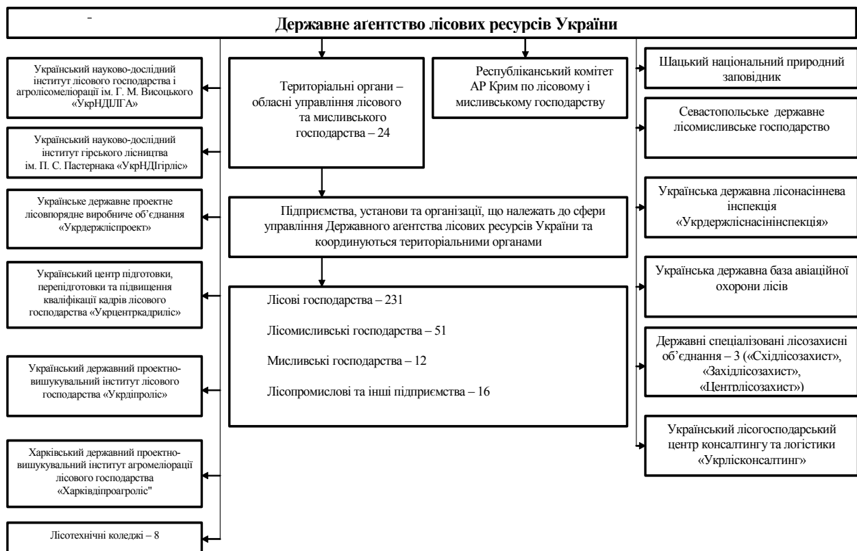
Рис. 1. Схема управління Державного агентства лісових ресурсів України

З схеми видно, що в галузі лісового господарства немає центрів, котрі займалися б інноваційним розвитком галузі; представлено лише кілька інститутів, які займаються науковою діяльністю всеукраїнського, а не регіонального значення.