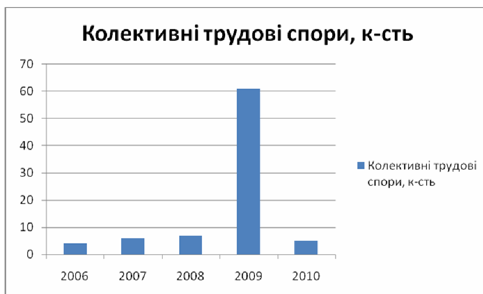
Рис. 2. Динаміка зміни кількості колективних трудових спорів на підприємствах регіону

Застосування економіко-математичних методів, опрацювання статистичних даних за підприємствами Тернопільської області виявило певну залежність економічних показників між станом конфліктності на підприємстві, станом фінансово-економічних показників (стабільністю його функціонування) та числом згаданих чинників, які в свою чергу також мають відповідні характеристики. Наприклад, числу конфліктних ситуацій, які виражаються в загостренні соціально-психологічного клімату на підприємстві, спадів виробництва, дефіциті ресурсів, порушення норм законодавства щодо оплати та охорони праці, порушення норм щодо укладання та виконання колективних договорів і угод, яким передують різні числа заяв, скарг і пропозицій, що знаходяться в окремій залежності від стилю і методів управління. Проаналізувавши економічний стан промисловості Тернопільщини, зокрема середньомісячну заробітну плату найманих працівників промисловості регіону, і кількістю зареєстрованих конфліктних ситуацій, ми дійшли висновку, що заробітна плата в середньому малими темпами, що є недостатнім показником в умовах інфляції. Така ситуація призводить до збільшення числа колективних трудових спорів на підприємствах (див.рис.2).